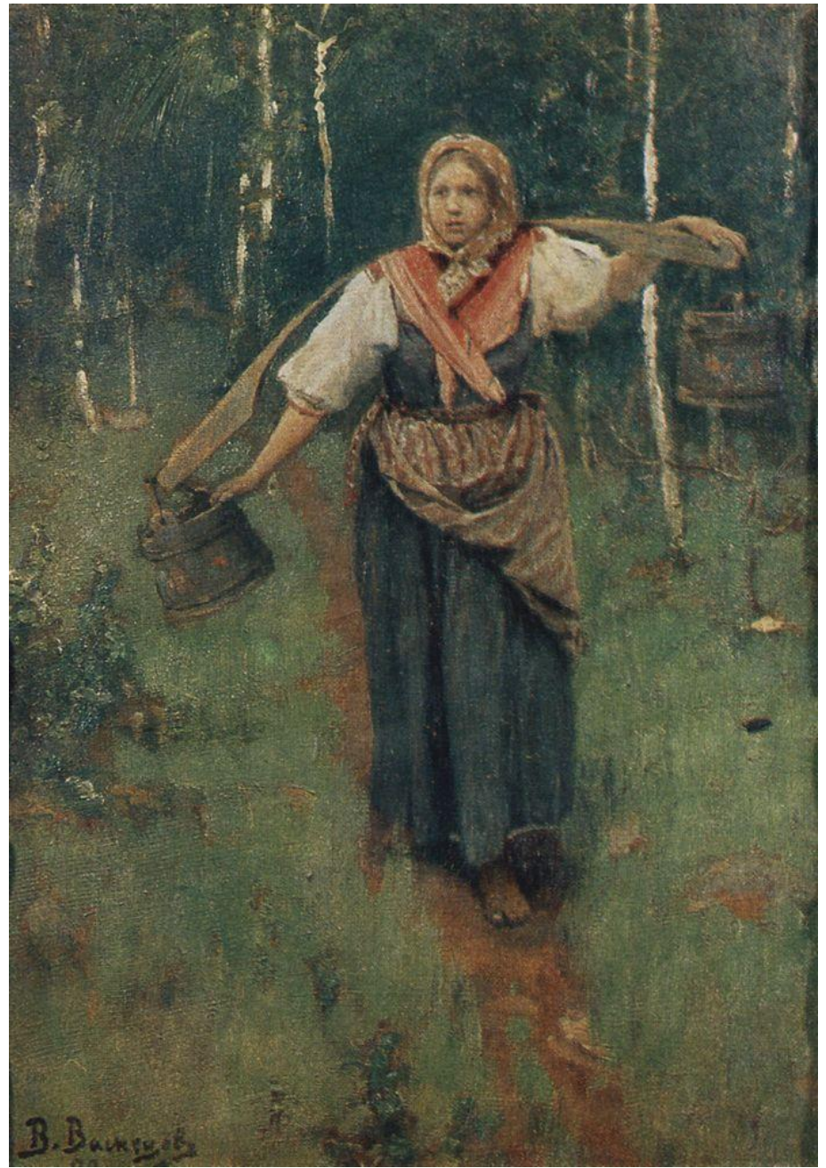
«Девушка с бадейками»