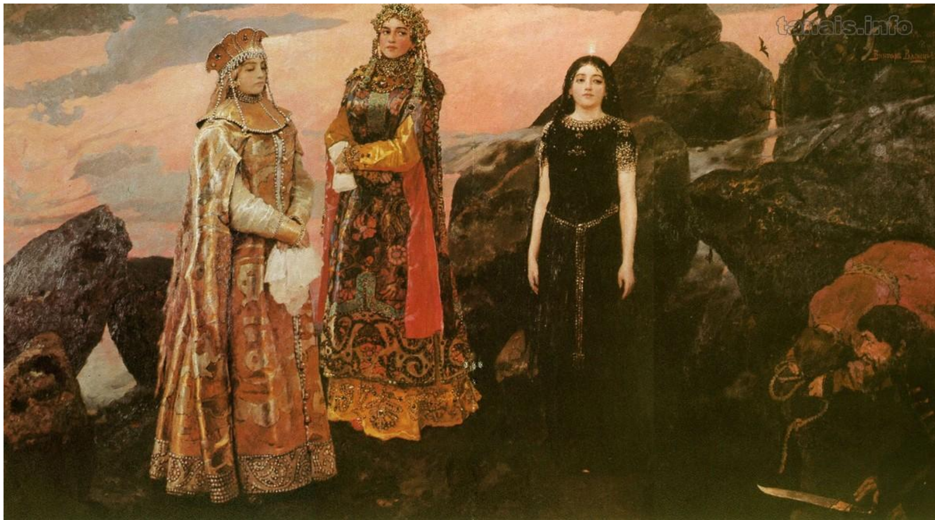
«Три царевны подземного царства»