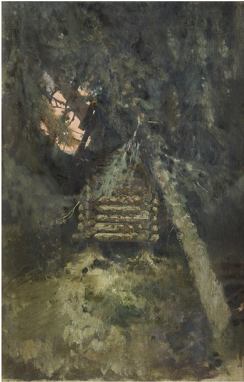
«Избушка на курьих ножках»