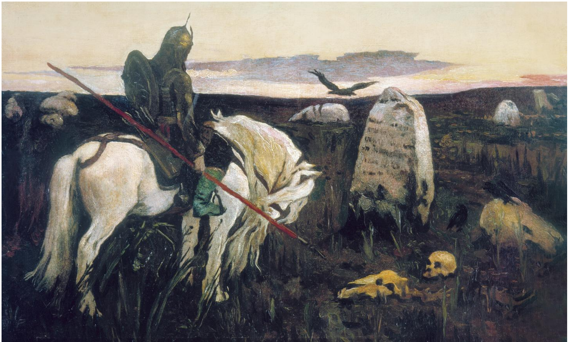
«Витязь на распутье»