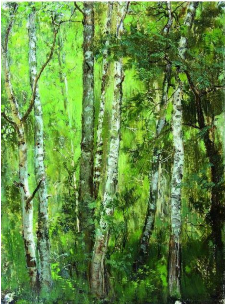
«Берёзовая роща в Абрамцево»