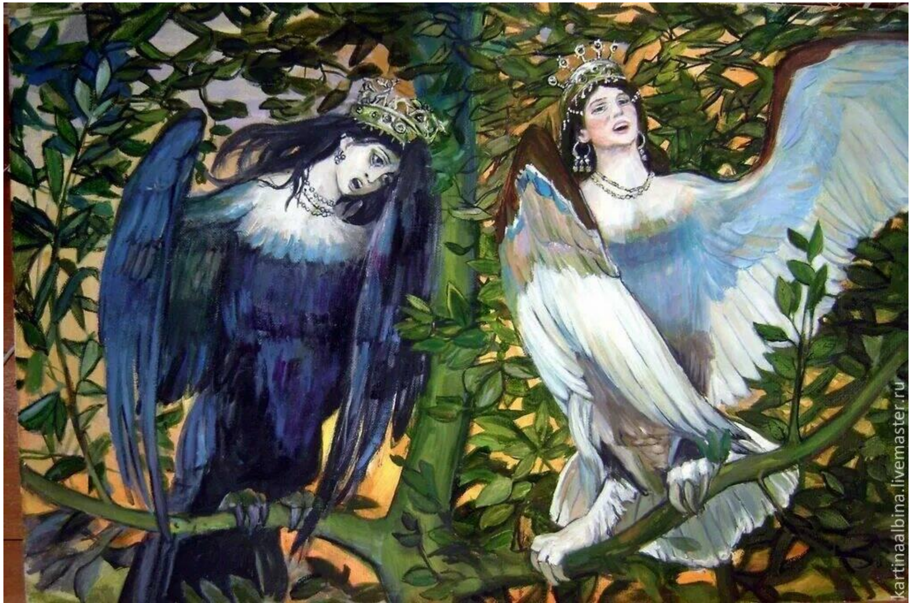
«Сирин и Алконост. Песнь радости и печали»