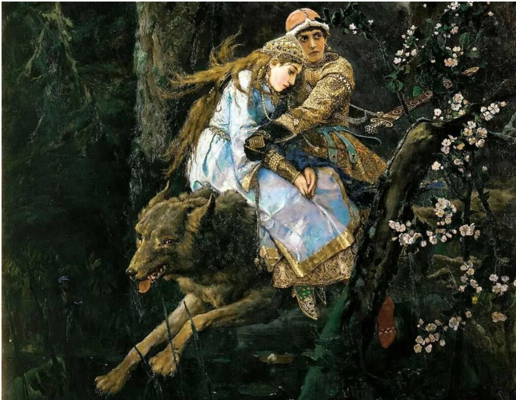
«Иван-Царевич на Сером волке»